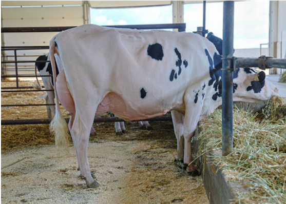
BENBIE A2P2 MADALYN DAM